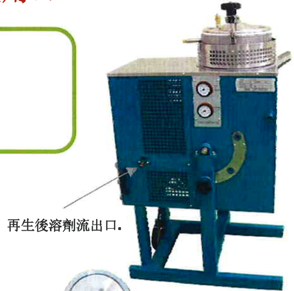
再生後溶劑流出口。