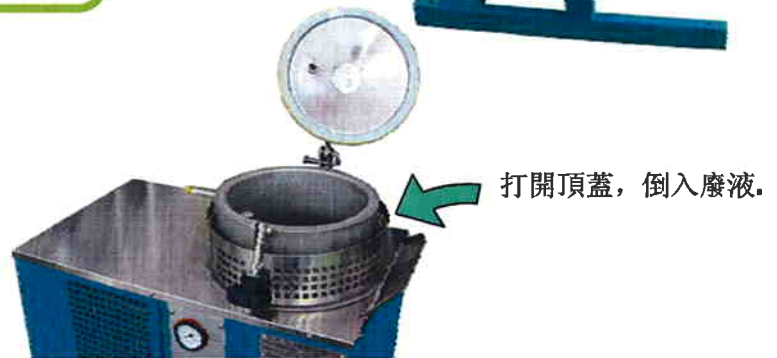
打開頂蓋，倒入廢液。