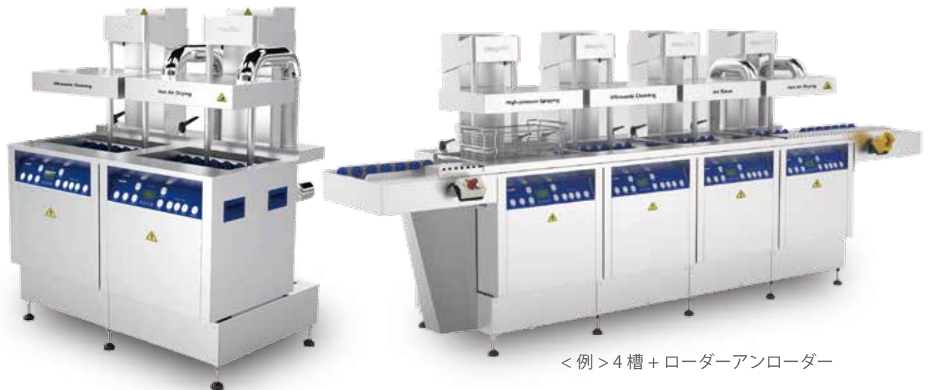
SC-CP500-2(ベーシックモデル)