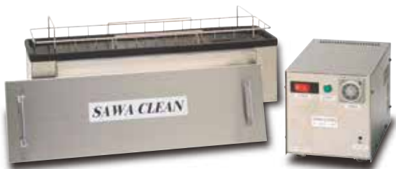
※洗浄かごはオプションです。